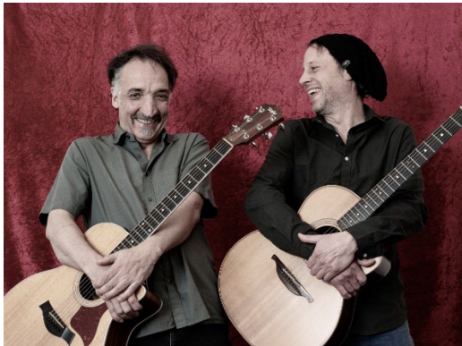
Gitarrenduo Ilimitado

Fotos (finden Sie in der E-Mail über den WeTransfer-Link!)