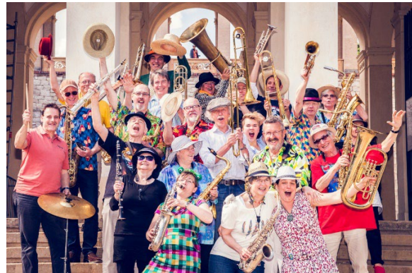
Die Tiere