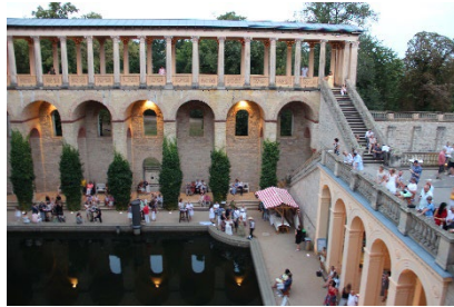
Italienischer Abend