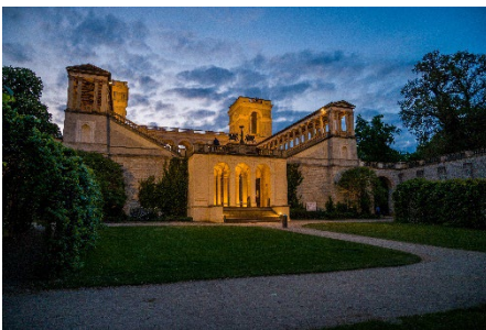
Letzte Mondnacht im Jahr