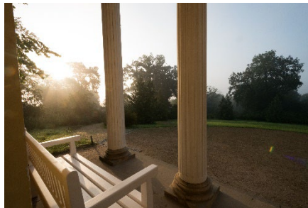
Blick vom Pomonatempel