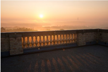
Sonnenaufgang vom Belvedere