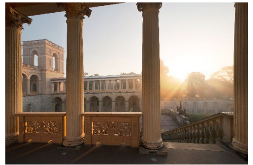
Innenhof Belvedere

Die Fotos können bei redaktioneller Berichterstattung kostenfrei verwendet werden, sofern der korrekte Bildnachweis angegeben wird.