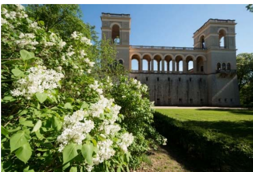
Belvedere, Nordseite