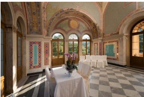
Maurisches Kabinett