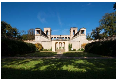
Schloss Belvedere