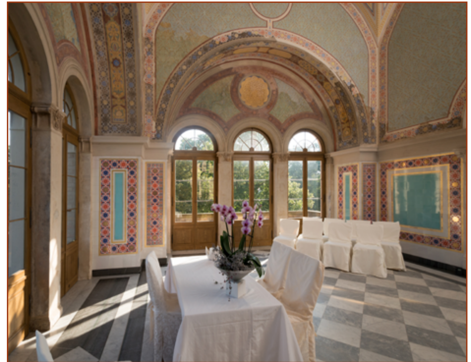
Das Maurische Kabinett im Belvedere Pfingstberg. The Moorish Cabinet in the Pfingstberg Belvedere.

When you were a child, did you dream about getting married in a palace? This dream can come true at the Pfingstberg Belvedere. High above the city of Potsdam, from May to October, the Standesamt Potsdam (Potsdam Registry Office) and the Förderverein Pfingstberg e.V. offer the experience of a wedding set before a romantic backdrop. The Moorish Cabinet in the palace's eastern tower, designed with ceiling paintings, marble floors and noble red-blue-gold tiles, offers a celebrational framework for an unforgettable setting to say "I do." After the ceremony, while your guests can spend time enjoying Potsdam's most beautiful views on a guided tour through the historical ensemble, you'll have an opportunity to have your wedding photos taken. Then come together with your wedding guests and clink glasses at a festive reception, or arrange an unforgettable celebration surrounded by the historical Pfingstberg ensemble.